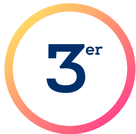
Lugar nacional QS World University Rankings 2024

Somos una Universidad Pública con más de 174 años de historia y al servicio de la sociedad, conformada por una comunidad de más de 25.000 estudiantes de pregrado, postgrado, educación continua y especialidades médicas. A su vez, contamos con más de seiscientos treinta académicos y académicas de jornada completa. Además, nuestra universidad es reconocida por sus 7 años de acreditación en todas las áreas por la Comisión Nacional de Acreditación de Chile y ocupamos el lugar N° 13 a nivel latinoamericano según el QS Latin America University Rankings 2024 y el lugar N° 3 a nivel nacional según el QS World University Rankings 2024.