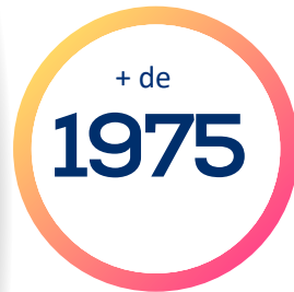
Publicaciones de alto impacto en el último año